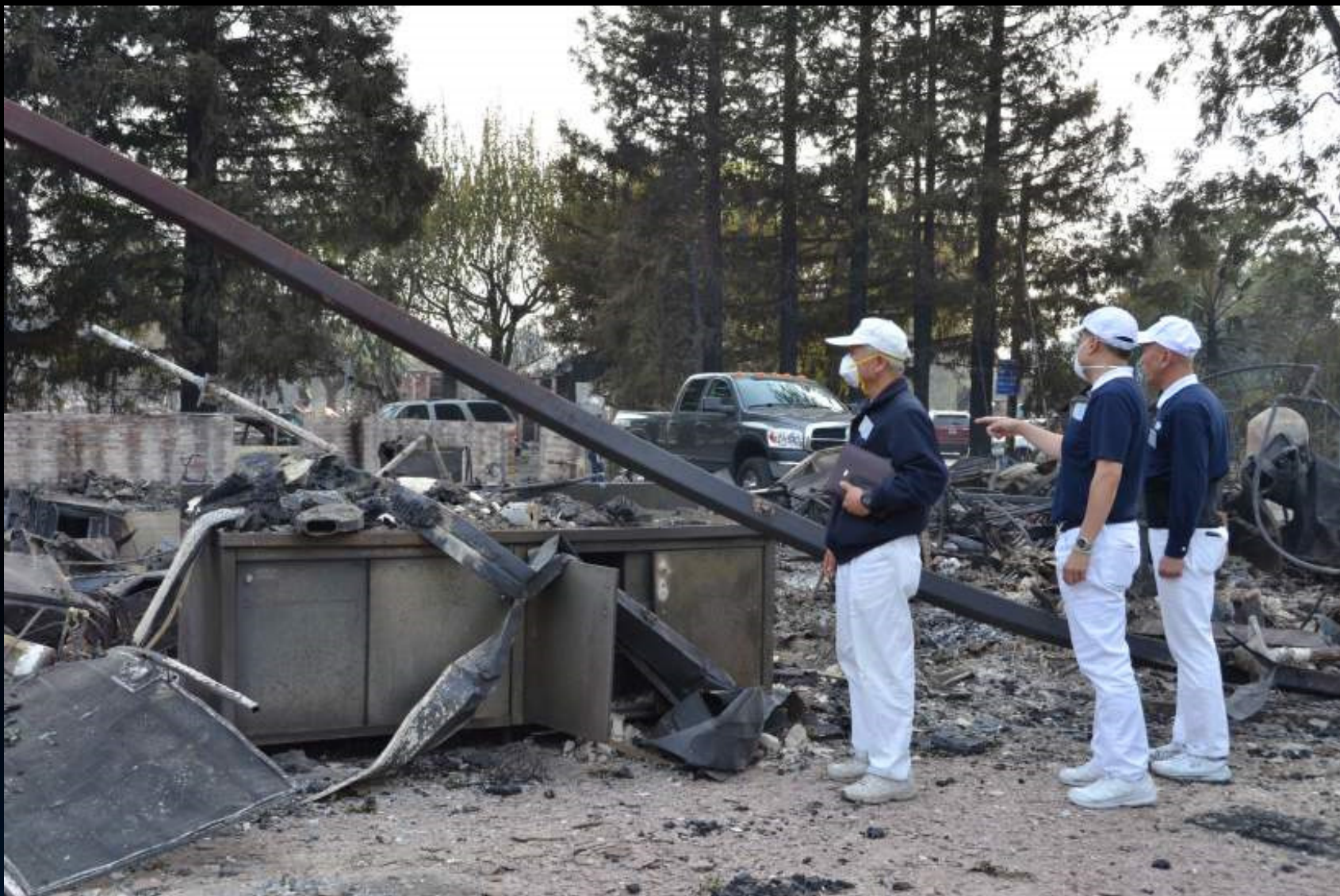
地點：Tubbs Fire, 聖塔羅莎