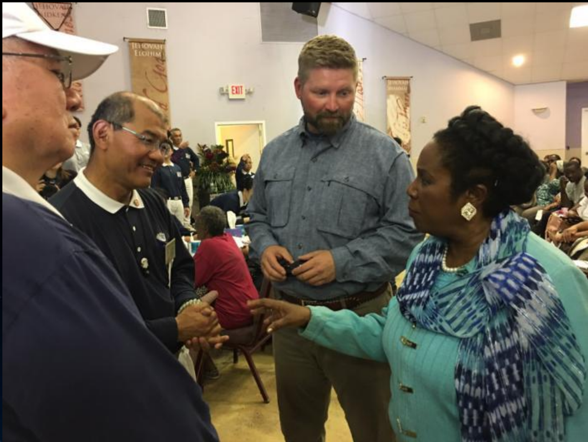
● 國會眾議員傑克森李 女士與志工互動。